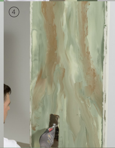
First in Spring H 16