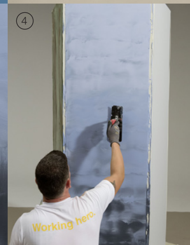
Water Falls W 76